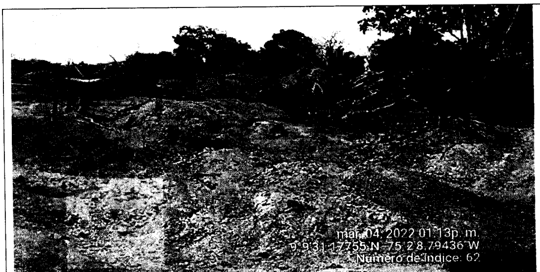
Imagen No.4 Tala de Árboles en el Área intervenida

También se pudo evidenciar que en esta área se vienen desarrollando actividades de tala y quema de especies de árboles de gran tamaño y desarrollo, sin contar con un permiso de aprovechamiento forestal. En la imagen No.4 se puede observar la tala de árboles en el área intervenida.