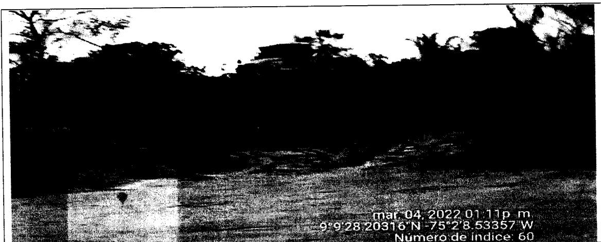
Imagen No.2. Cargador Minero operando en frente de explotación

Situados en terreno pudimos evidenciar que el área intervenida corresponde a unos 4000 m 2 aproximadamente, donde se pudo constatar la operación de equipos mineros realizando la explotación en varios frentes de trabajo, también pudimos observar material de construcción acopiado. Además, se pudo evidenciar que el material extraído está siendo transportado por la vía Since - Granadas - Buenavista por Volquetas de 14 toneladas de capacidad aproximadamente, las cuales se parquean en la vía Granadas-Since como se puede evidenciar en la imagen No. 3/