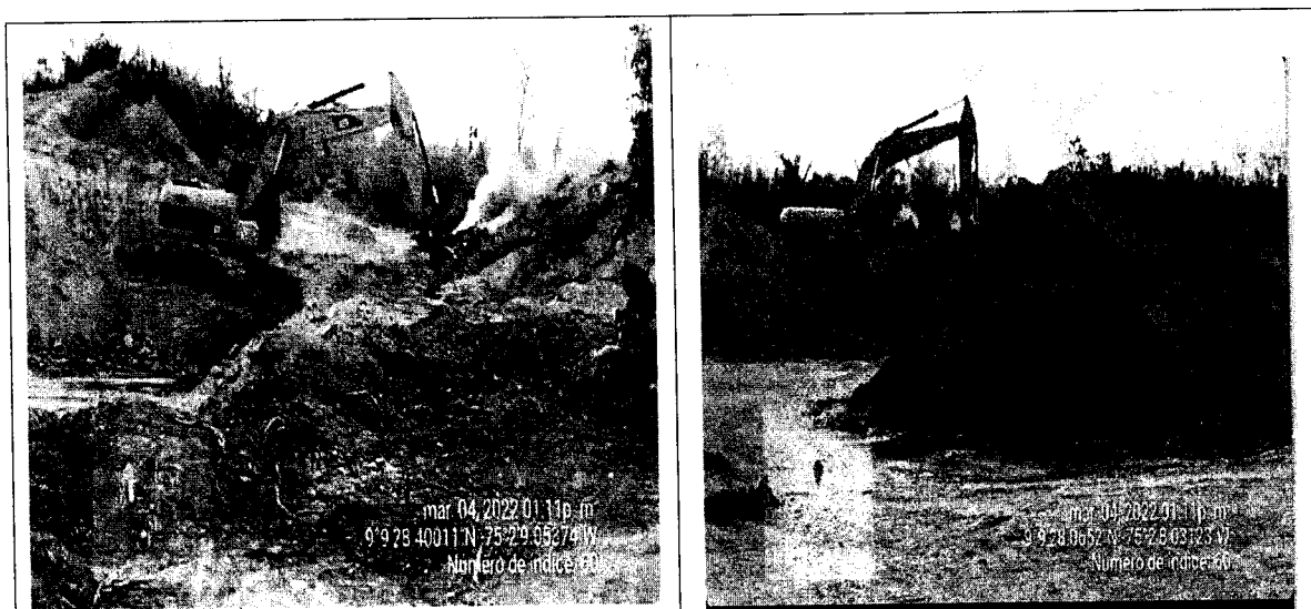
Imagen No.1. Retroexcavadora de oruga operando en frente de explotación