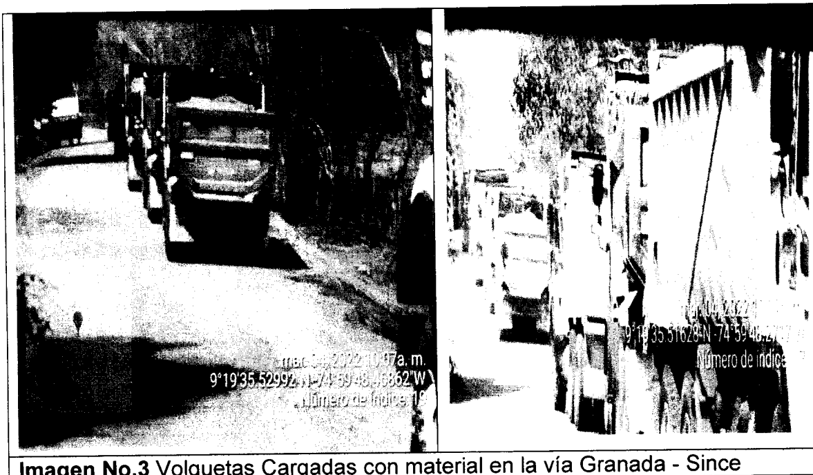
Imagen No.3 Volquetas Cargadas con material en la vía Granada - Since

También se pudo evidenciar que en esta área se vienen desarrollando actividades de tala y quema de especies de árboles de gran tamaño y desarrollo, sin contar con un permiso de aprovechamiento forestal. En la imagen No.4 se puede observar la tala de árboles en el área intervenida.