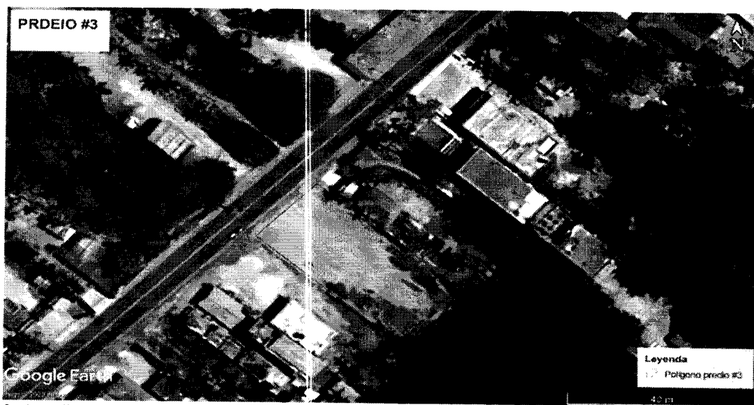
Figura 16. Localización del área de interés. Predio N°3 - Frente al restaurante Costa Linda, Coveñas.

Al momento de la visita se pudo constatar un predio con un área de aproximadamente 900 m 2 , donde se evidenció elevación artificial del suelo con material seleccionado de cantera.