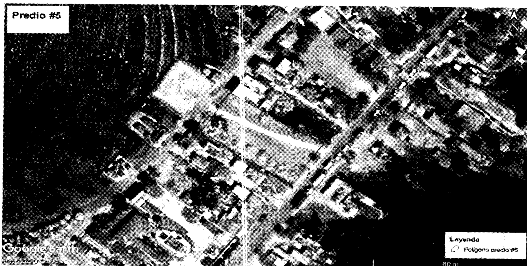
Figura 33. Localización del área de interés. “Predio N°5 - diagonal a cabañas Playa Tiburón, Coveñas.

Al momento de la visita se pudo constatar un predio con un área de aproximadamente 1700 m² con cerramiento conformado por estacas de madera y alambre de púas. En esta propiedad se evidenció elevación artificial del suelo con material seleccionado de cantera, acopio del mismo material usado para la elevación artificial y acopio de bloques de cemento.