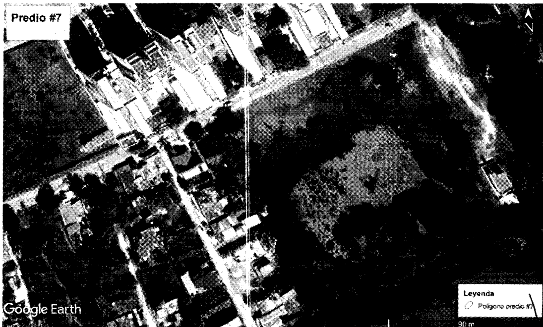
Figura 46. Localización del área de interés. Predio N°7 – Frete al hotel Entre Mares - municipio de Coveñas.