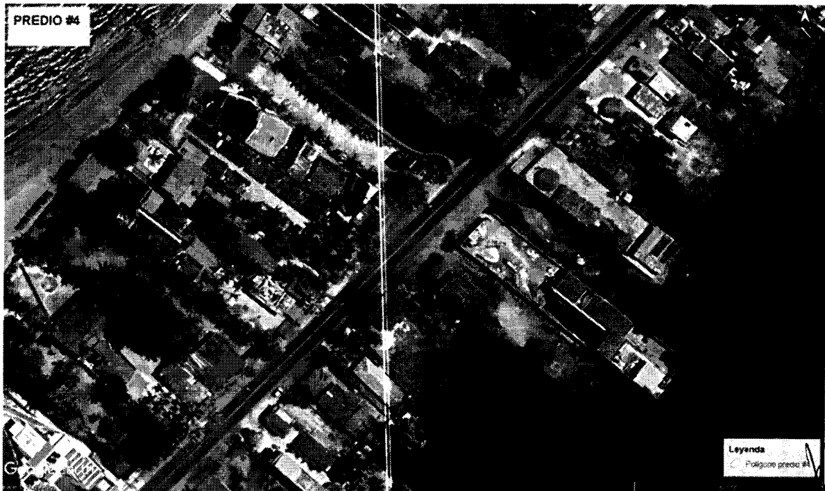
Figura 24. Localización del área de interés. Predio N°4 - diagonal a cabañas Playa Tiburón, Coveñas.