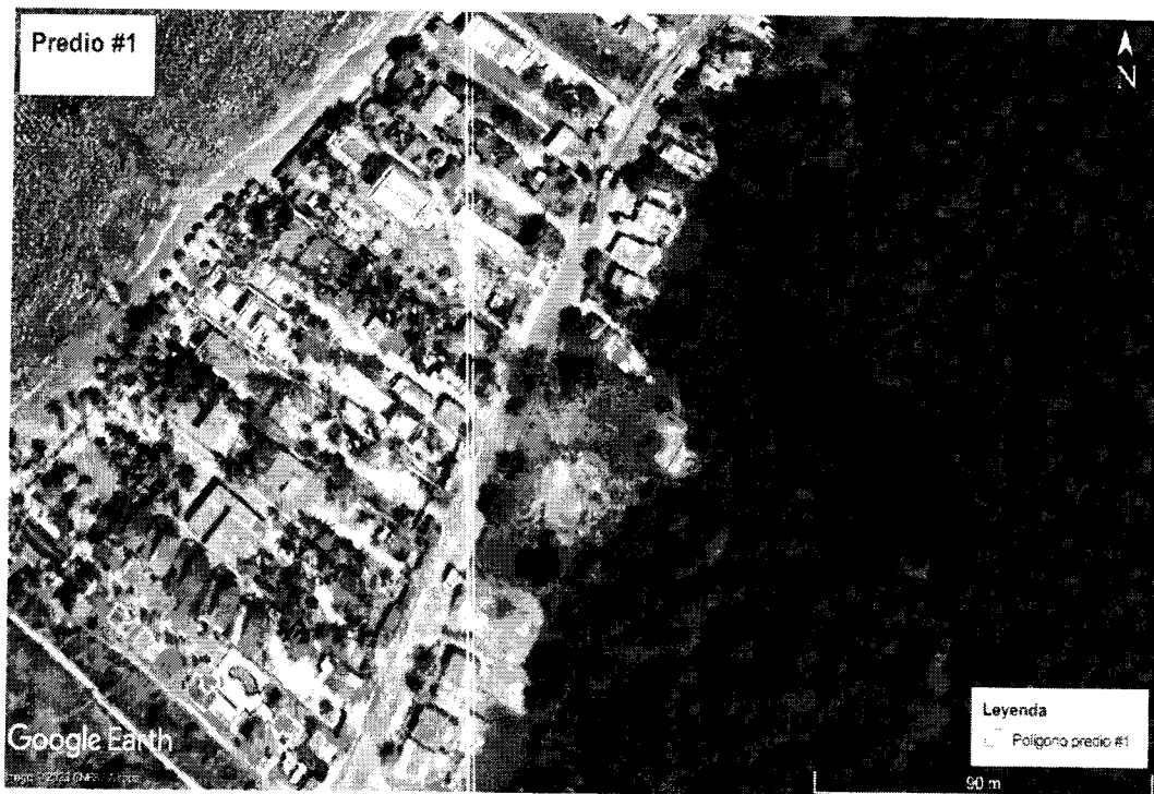
Figura 1. Localización del área de interés. Predio N°1 - municipio de Coveñas.

Al momento de la visita se pudo constatar un predio con un área de aproximadamente 2500 m² , donde se evidenció quema de vegetación herbácea y residuos sólidos, algunos pobladores reportaron que esa actividad fue realizada por actos vandálicos y que al lugar de los hechos llegó el personal del equipo de bomberos del municipio de Coveñas. Además, se encontraron restos de materiales de construcción, los cuales fueron acopiados en ese lugar, en el área se observaron algunos puntos de acopio de residuos sólidos ordinarios mezclados con material vegetal. En el predio se identificaron especies arbóreas tales como