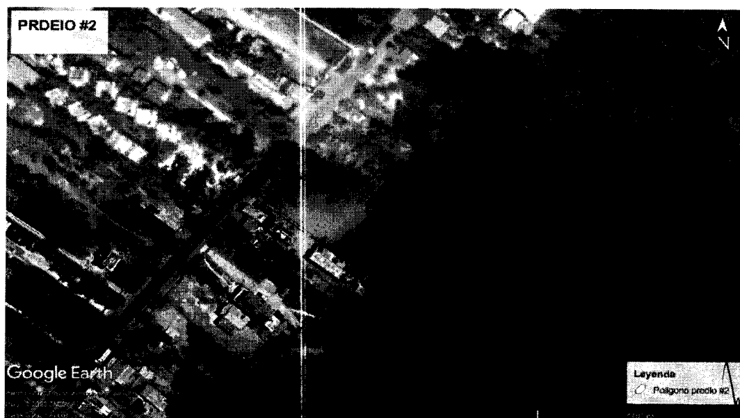
Figura 6. Localización del área de interés. Predio N°2 - Diagonal a Cabañas Aqua Blue, Coveñas.