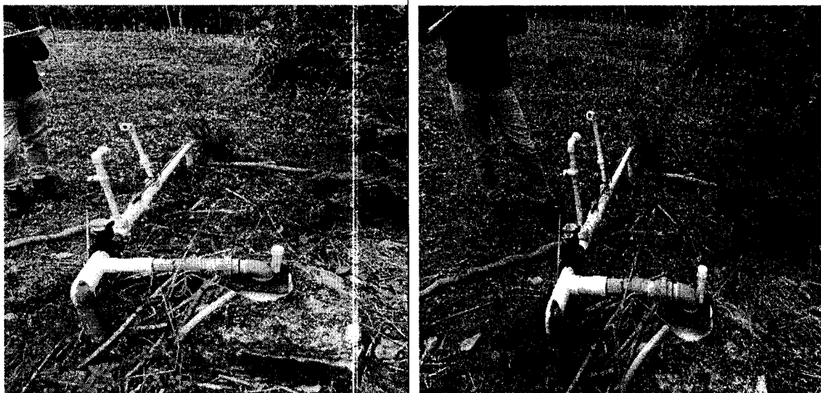
Pozo No. 52-II-C-PP-35 Finca Villa Margarita.