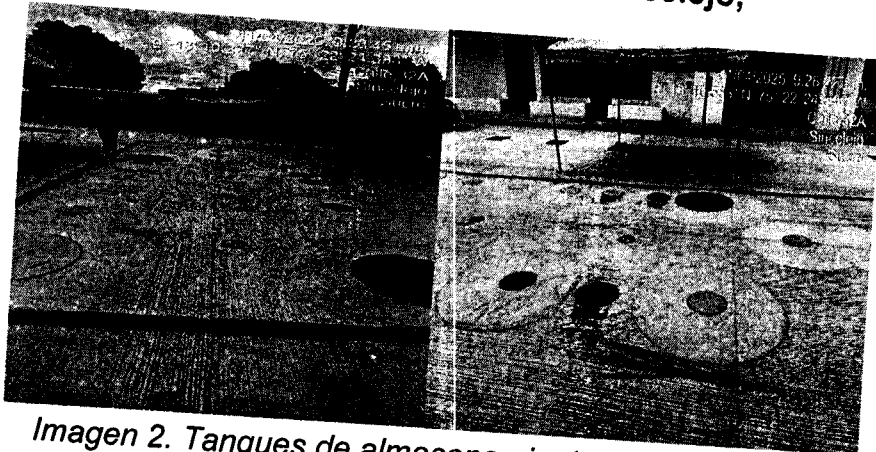
Imagen 2. Tanques de almacenamiento de combustible.

LA CORPORACIÓN AUTÓNOMA REGIONAL DE SUCRE - CARSUCRE. SECRETARÍA GENERAL. Sincelejo,