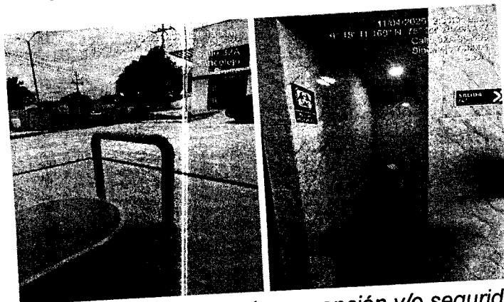
Imagen 3. Implementos de prevención y/o seguridad.

LA CORPORACIÓN AUTÓNOMA REGIONAL DE SUCRE - CARSUCRE. SECRETARÍA GENERAL. Sincelejo,