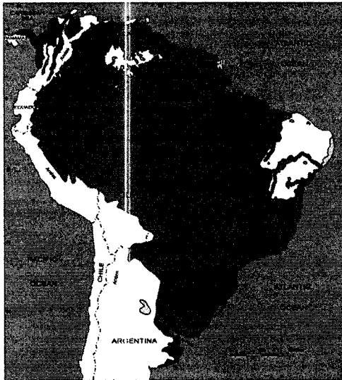
Figura 2. Imagen que muestra la Distribución geográfica del género Hydrochoerus . Área verde : Hydrochoerus hydrochaeris . Área azul: Hydrochoerus isthmius (Tomado y modificado a partir de la figura 1.4 de Moreira et al., 2013).

Ecología e importancia en el ecosistema: Los capibaras o chigüiros ( Hydrochoerus hydrochaeris ) desempeñan un papel crucial en los ecosistemas de humedales y sabanas de América del Sur. Actúan como dispersores de semillas, regulan la vegetación, sirven de presa para depredadores y modifican su hábitat al facilitar el flujo de agua. Además, son indicadores ecológicos que reflejan la salud ambiental. La composición de la dieta y las preferencias alimenticias de los chigüiros cambian estacionalmente como respuesta a los cambios temporales del clima que influyen en la calidad y abundancia de los forrajes (Barreto & Herrera, 1998; Quintana et al., 1994). Así mismo es una especie clave en las cadenas tróficas de los ecosistemas donde habita. Múltiples estudios han reportado la especie como reservorios de virus y parásitos.