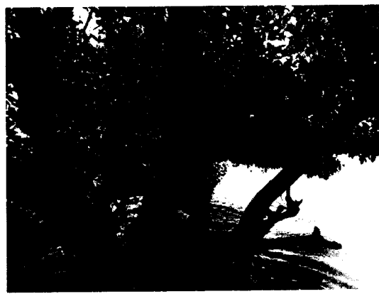
Imágenes 2,3,4,5. Presencia de CIENTO SESENTA Y OCHO (168) árboles que serán objeto de aprovechamiento forestal UNICO .

Durante la visita se corroboraron las medidas dasométricas (medidas de las dimensiones de los árboles y volumen), la evaluación de las especies forestales objeto de aprovechamiento, en donde se constató el debido marcaje y