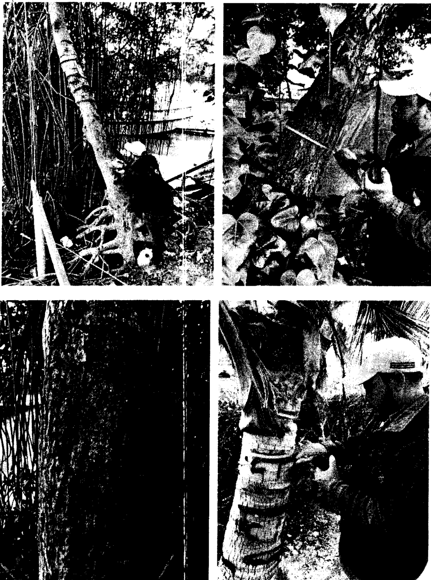
Imágenes 6, 7, 8 y 9. Marcaje de los árboles a aprovechar (Inventario forestal).

enumeración propio de que se realizó el inventario forestal con anterioridad, así mismo, se evidenció que no se han iniciado actividades de intervención relacionadas con la ejecución del aprovechamiento, así como se logra apreciar en las imágenes 6, 7, 8 y 9. Durante el recorrido, fueron identificados individuos arbóreos en veda.