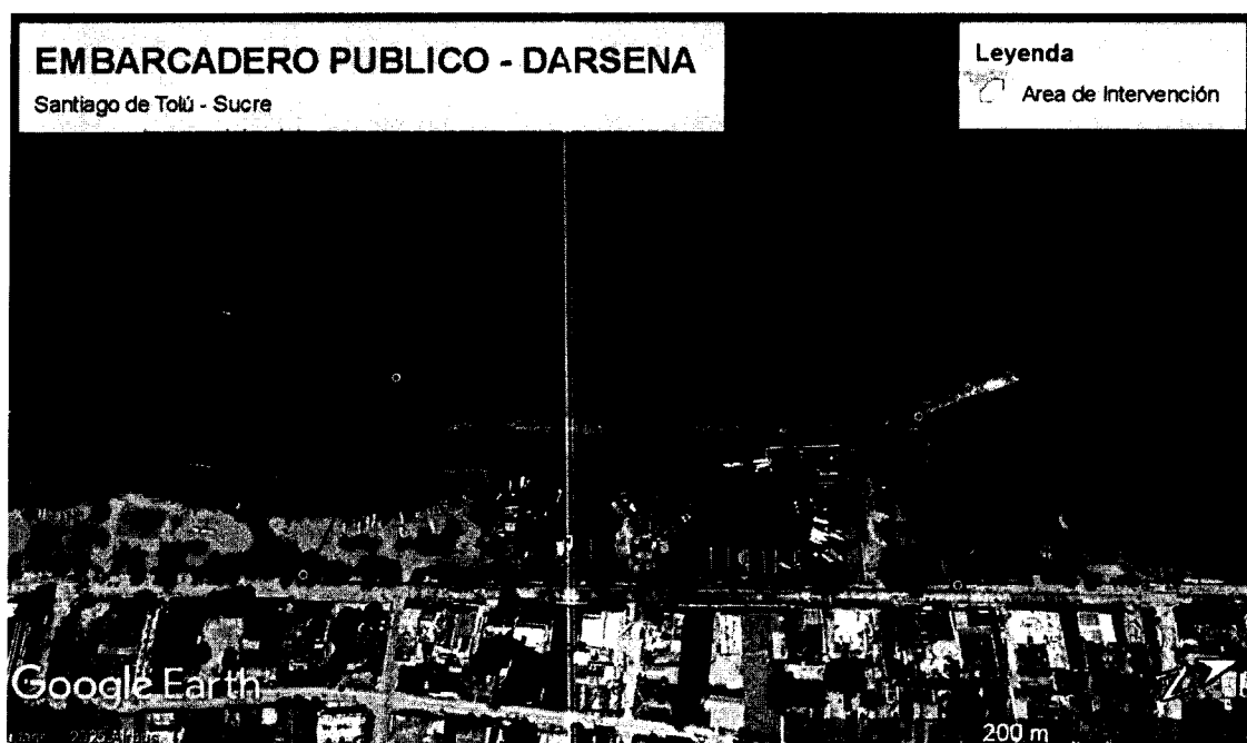
Figura 1. Localización del área de interés, Embarcadero Publico – DARSENA, municipio de Santiago de Tolú - departamento de Sucre.