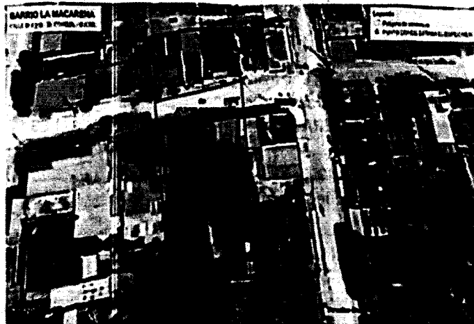
Sitio: Calle 37 # 21B - 26, barrio La Macarena, municipio de Corozal.