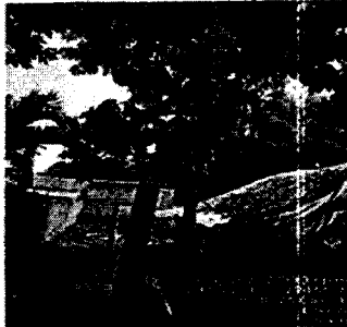
Fotografía 3. Nuevas especies arbóreas sembradas ( Mangifera indica ).