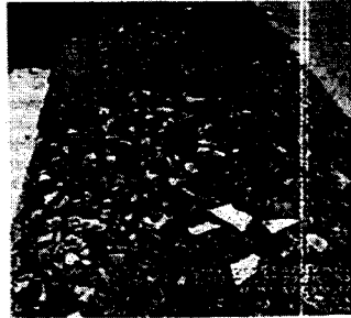
Fotografía 1. Sitio donde estaba ubicado el espécimen arbóreo.