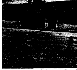
Fotografía 2. calle 37 # 21B - 26, barrio La Macarena, municipio de Corozal.