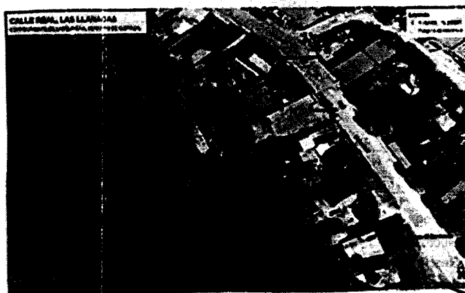
Sitio: Calle Real, Corregimiento de las Llanadas, Corozal.