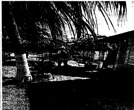
Figura 2, 3, 4 y 5. Verificación en campo del área objeto de la solicitud.