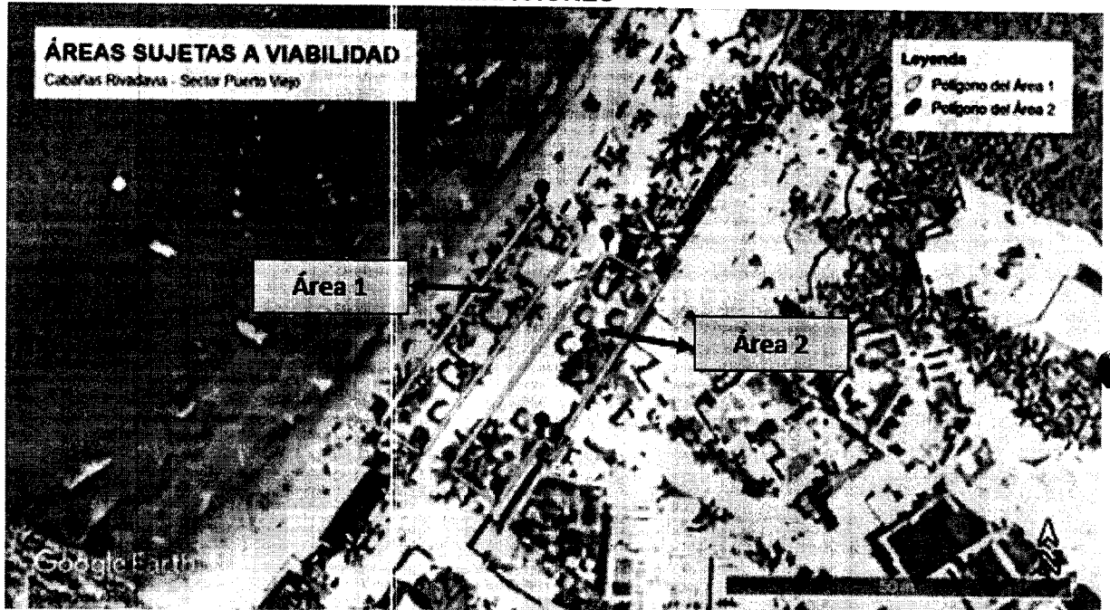
Figura 1. Localización geográfica de las áreas sujetas a viabilidad.