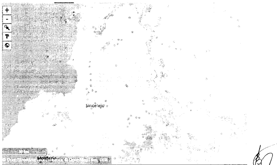
Figura 1. Distribución de la especie Iguana guana en el departamento de Sucre.

3.4 Distribución geográfica: se distribuye en Costa Rica, Panamá y en gran parte de Sudamérica entre los 0-1000 m. En Sudamérica se encuentra en Venezuela, Colombia, Ecuador, Perú, Bolivia, Paraguay y Brasil y ha sido introducida en el sur de Florida y Hawaii. Iguana guana en Colombia está presente en los valles interandinos, Amazonas, Orinoquia, costas caribe y pacífica, incluidas las costas de San Andrés y providencia y Santa Catalina (González A. y Ríos V. 1997). En toda la jurisdicción de CARSUCRE, según De la ossa- Lacayo et., al (2017) se pueden encontrar en donde haya disponibilidad de árboles (zonas boscosas, sabanas arboladas, sabanas antrópicas con cobertura arbórea, bosques de galería). Habitante, incluso de zonas arboladas de poblados y ciudades.