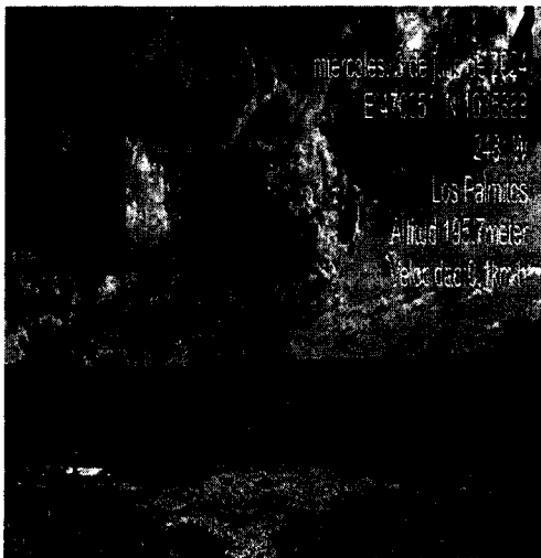
Imagen 1. Área de la Planta “ENCONCRETOS”.